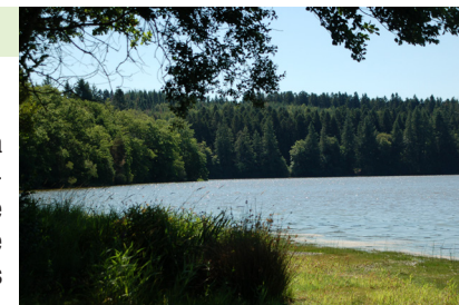
Étang de Tyx

4 Après l'église, couper la D 95 et poursuivre vers Chalus, sur 750 m. 5