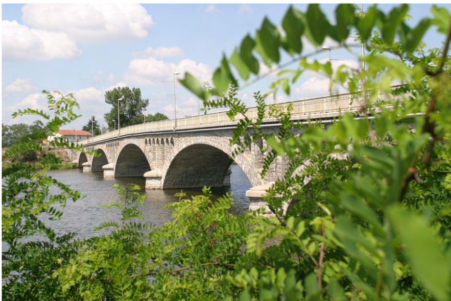
Pont de Feurs sur la Loire