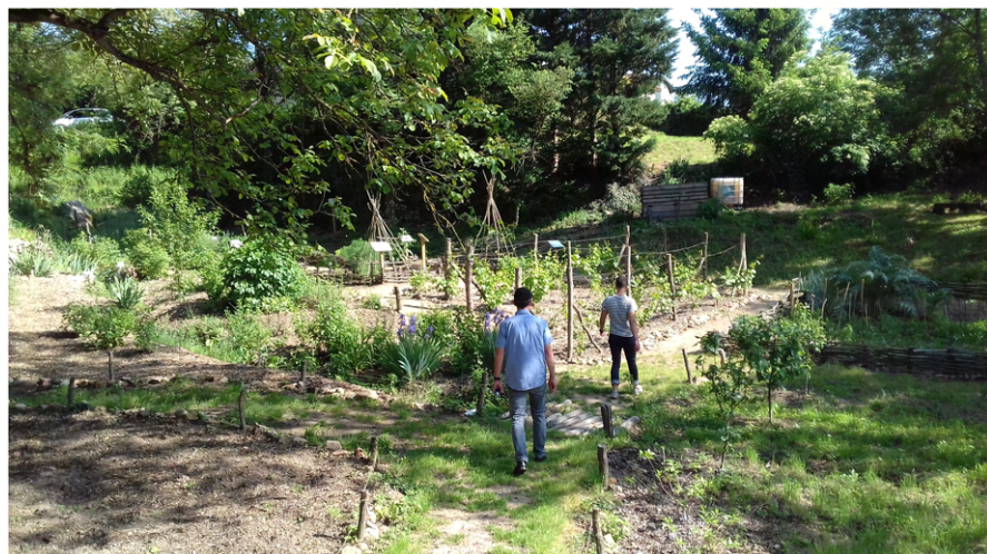
  O.T. Forez Est